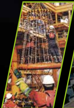
OLIE- EN GASINDUSTRIE